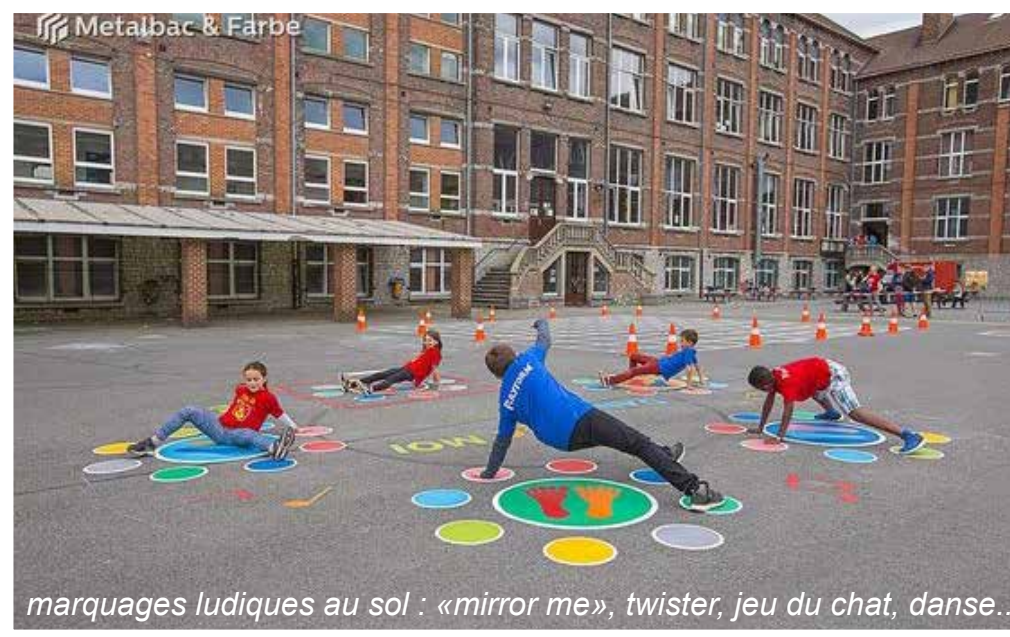
marquages ludiques au sol : «mirror me», twister, jeu du chat, danse...

Avant-Projet : avril 2025 Réalisation : automne 2025