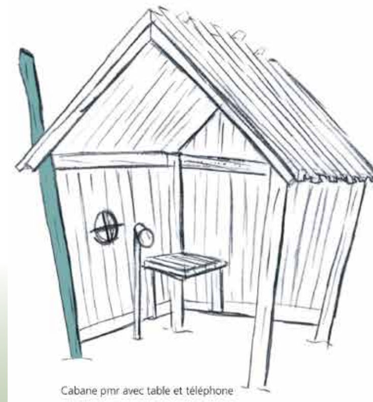
Cabane pmr avec table et téléphone