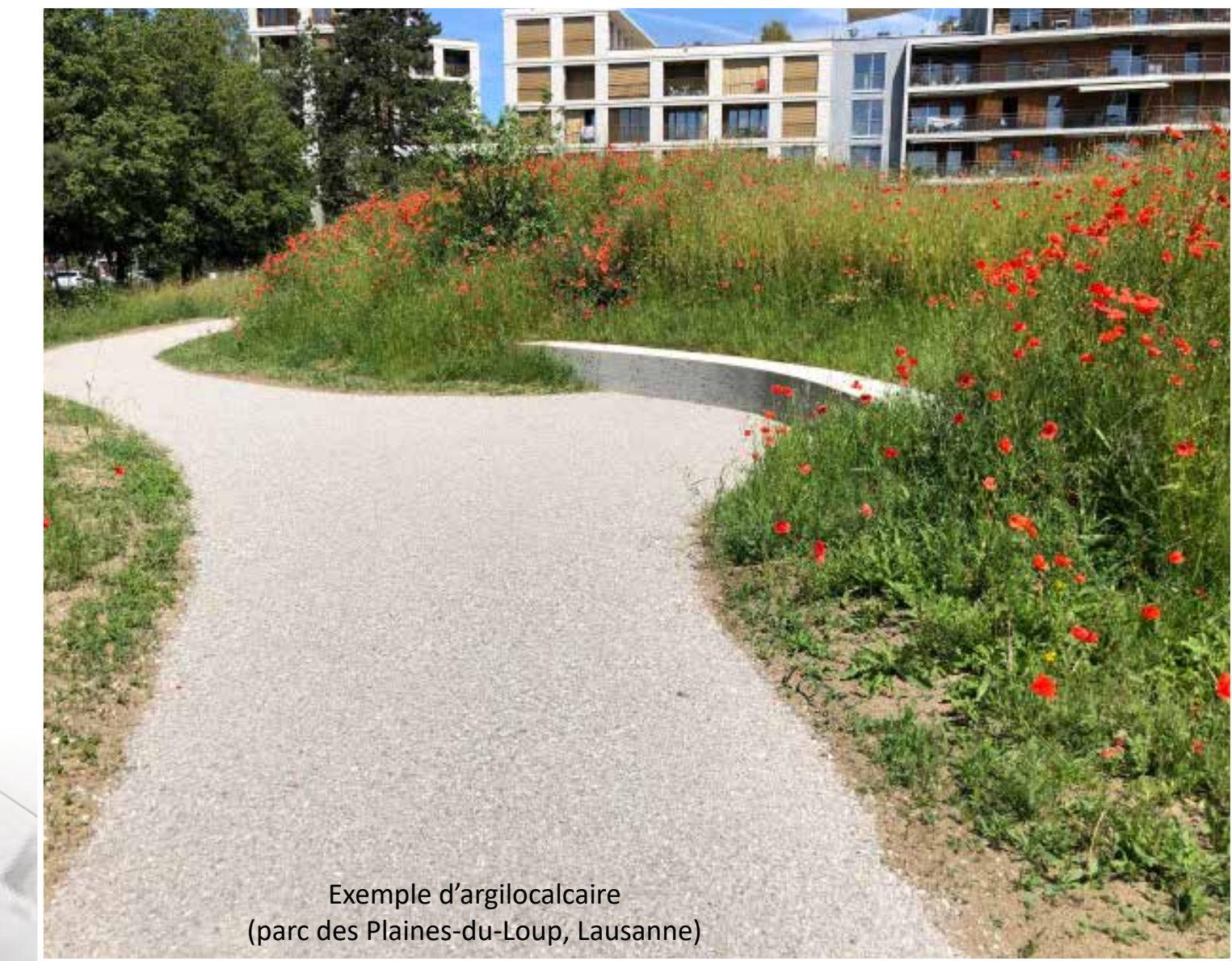
Exemple d'argilocalcaire (parc des Plaines-du-Loup, Lausanne)