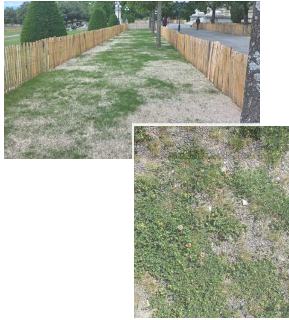
Exemple de gravier-gazon (Allée Ernest-Ansermet, Esplanade de Montbenon) en cours de verdissement